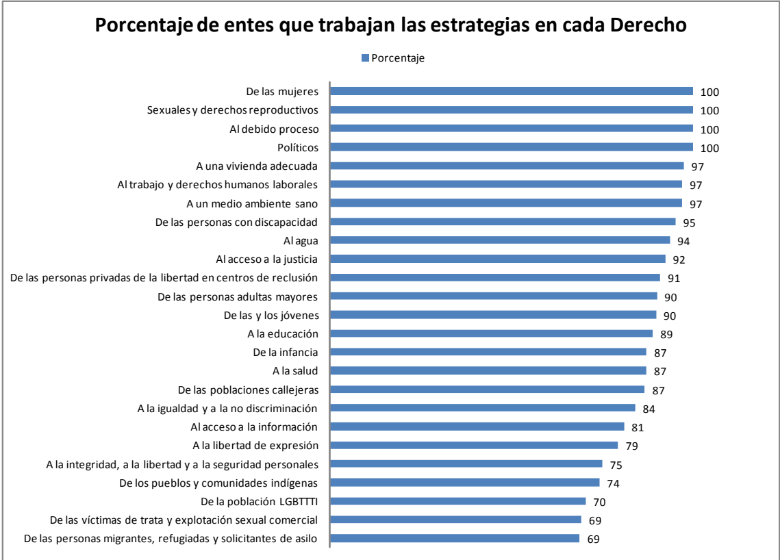
Gráfico 2 Estrategias trabajadas por ente según derecho y grupo de población al que pertenecen